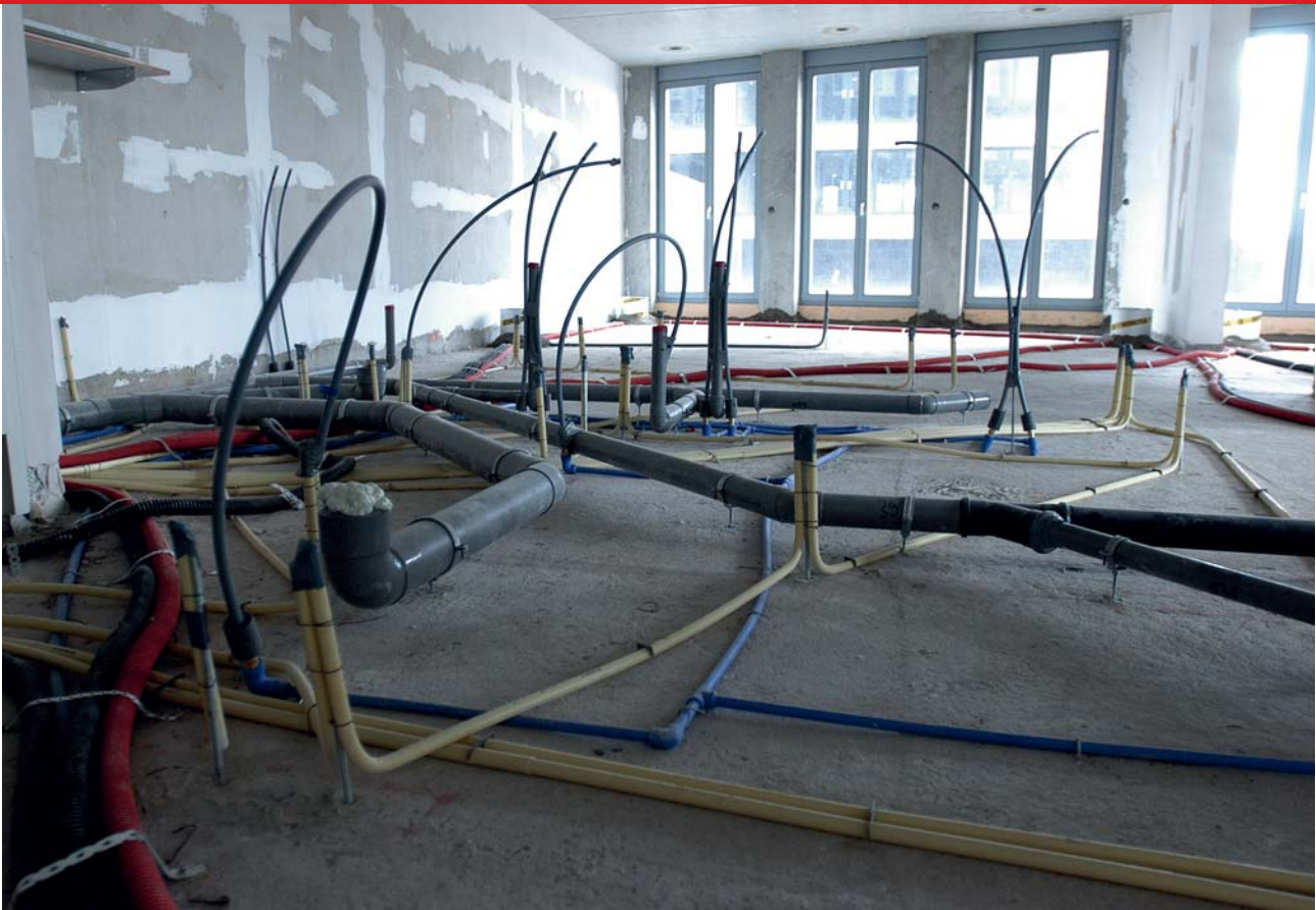
1. Op de vloer concentreert zich steeds meer horizontaal installatiewerk.

bankgaranties, kosten bouwkeet et cetera). Wel zijn de kosten voor onderaanneming meegenomen.